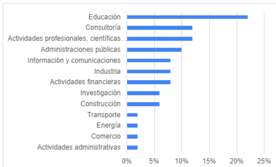
Figura 2. Principales actividades de los egresados de MEGIN (porcentajes)

Los egresados MEGIN han encontrado trabajo en empresas muy importantes dentro de su sector de actividad como Repsol, Telefónica o Citibank. Igualmente, es destacable su presencia en empresas de consultoría como Science & Innovation Link Office (SILO), Núbica, Minsait, Ayming o Zabala Innovación; en organismos públicos como el Ministerio de Medioambiente de Perú o la Dirección General de Industria (Generalitat de Catalunya); y en distintas universidades nacionales y extranjeras.